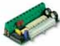
PIU tarjeta de ampliación funciones para la central de mando