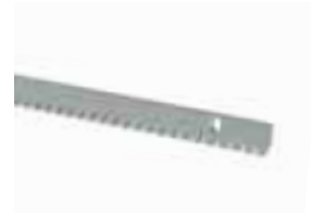
ROA8 cremallera M4 30x8x1000mm galvanizada, con tornillos y distanciadores