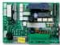
THA6 central de recambio, sólo tarjeta para TH2251