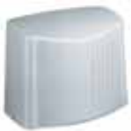
THA1 cárter de aluminio fundido