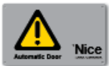
TS placa de señalización