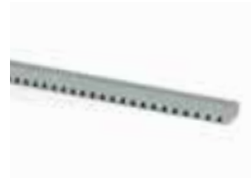
ROA7 cremallera M4 22x22x1000mm galvanizada