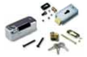
PLA11 electrocerradura 12V horizontal (obligatoria para hojas superiores a 3m)