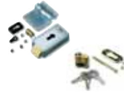
PLA10 electrocerradura 12V vertical (obligatoria para hojas superiores a 3m)