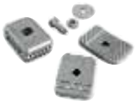
PLA13 fines de carrera mecánicos en apertura y cierre