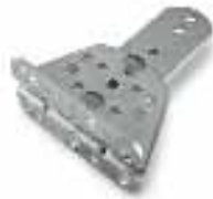
PLA14 estribo trasero regulable a enroscar