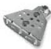
PLA15 estribo delantero regulable a enroscar